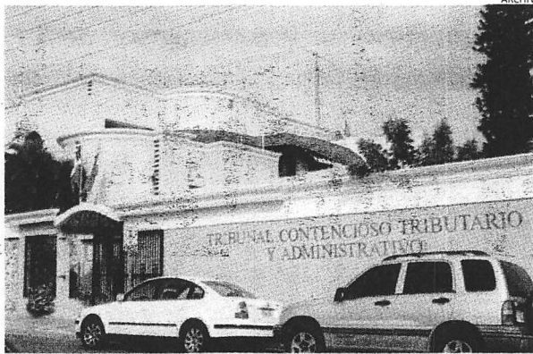
Sede del Tribunal Superior Administrativo.

Añadió que el reglamento también prohíbe que quien haya sido pre-candidato en un proceso presidencial por otra or-