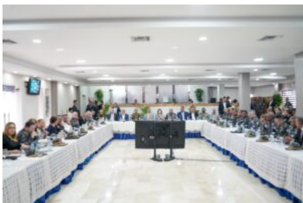
Foto 3... Vista de los participantes, durante la reunión de seguimiento al Plan de Seguridad Ciudadana.