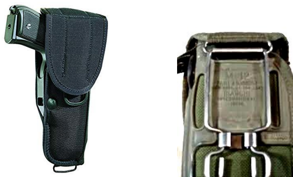
Diseño gráfico de referencia: